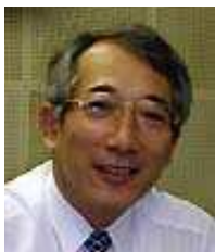
吉川 敏一 教授